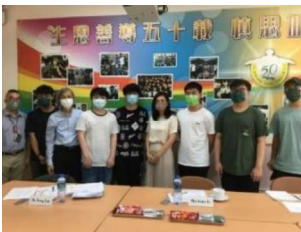
基金受託人與部分中六受惠學生