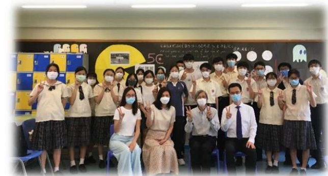
基金受託人與老師、部分受惠學生及申請學生

資助一些有志於學習，但成績屬於中游，卻欠缺資源的中學生參加英文課外補習，借此提升學生的英語水準，從而提升他們入讀大學的機會。