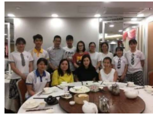
基金受託人與受惠學生茶聚