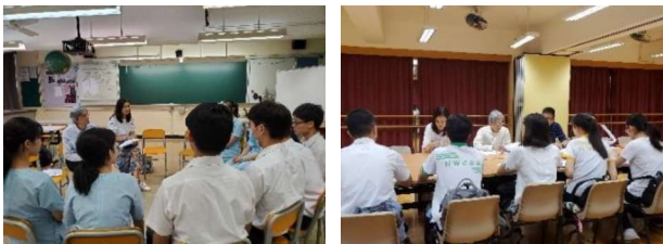
基金受託人與新申請學生進行面試