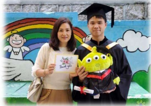
李同學參與計劃兩年，成功升讀大學心儀學科，並以一級榮譽畢業