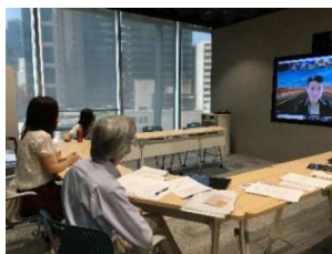
基金受託人向受惠學生了解計劃成效